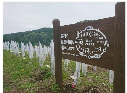
図3 矢板市内の皆伐再造林現場

川上、川中、行政により矢板地域の森林資源の主伐・再造林による持続可能な利用の推進を通じて林業の成長産業化を実現するとともに、地域材の適切かつ安定的な供給と建築物等における木材利用の推進を通じた二酸化炭素の吸収・固定の強化と増大を図り、我が国における脱炭素社会の構築に貢献するための「矢板市林業成長産業化推進アクションプラン」が策定されたことによる。