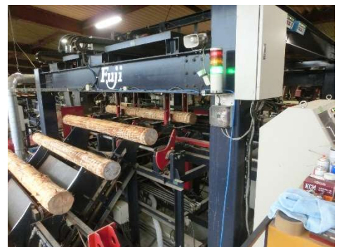
図4 製材されるヒノキ

素材生産事業者や製材加工事業者、地域の工務店、ハウスメーカー、木質バイオマス発電事業者、行政などが一堂に会する機会を創出し、知恵を絞っていくことが大切である。矢板市林業・木材産業成長化推進協議会は令和5年4月以降も活動を継続・発展していく予定であり、協定の円滑な推進に努力していく。