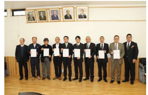
図2 協定締結したメンバー

森林・林業・木材産業等川上(素材生産事業者)、川中(製材加工事業者)、川下(工務店、ハウスメーカー、木質バイオマス発電事業者など)が連携・協力して地域材の安定的な需要・供給体制を構築するために、「矢板地域の森林資源の持続可能な利用を推進するための木材の安定需給に関する協定」を令和4年1月28日に締結した。