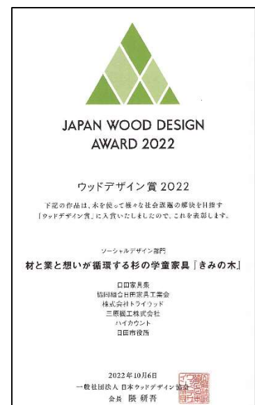
図3 ウッドデザイン賞 2022 受賞