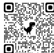
図4 web ページ QR コード