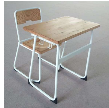
図1 完成した学校机“きみの木”

“きみの木”の図面については、各地域から要望があれば提供することを予定しており、各地域の木材を活用した“きみの木”を導入することが可能。“きみの木”を導入することで森林環境譲与税の活用を図りつつ、森林を守り、育て、活かす取組みを進めましょう。