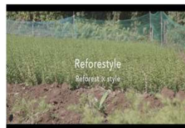
図5 市産材活用住宅のPV