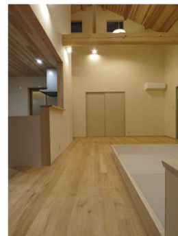
図3 市産材活用住宅の内観 （床材：シイ、天井：スギ）