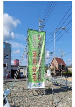
図4 市産材活用住宅ののぼり旗