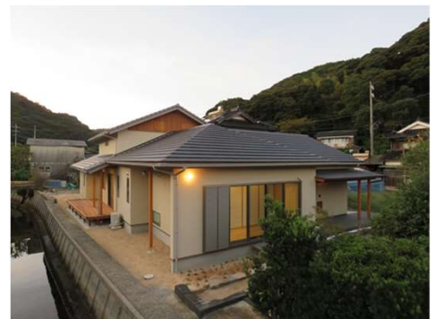
図2 市産材活用住宅の外観

また、市民の方々にもPVなどを活用し認知度をさらに向上させ、市民の方々と一緒に取組の輪を広げていく。