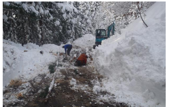
図2 冬季の伐採・搬出路の除雪作業 (工程にロスを生じ、高コスト要因となる)

数年間協業作業を続けることで、双方の技術・技能水準を目合わせることが必要である。相互の信頼関係ができて、初めて年間事業計画にワークシェアを組み入れ継続される。