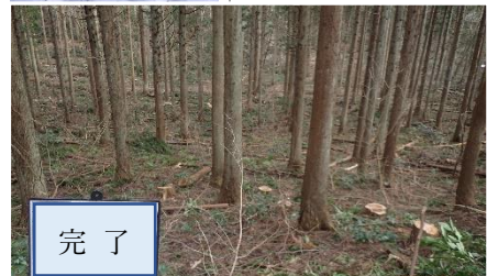
図3 少雪地での間伐施業をワークシェア