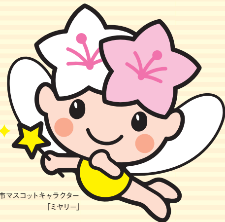
宇都宮市マスコットキャラクター 「ミヤリー」